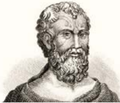
Zenón de Citio. Filósofo que vivió a finales del siglo IV a.C.

El estoicismo se centra en la fortaleza ante la adversidad y en la capacidad de mantener la calma y el juicio en situaciones difíciles. No es una filosofía que rechace las emociones, sino que aboga por el control de las mismas, evitando que las reacciones impulsivas dominen nuestras acciones. Esto es particularmente relevante en un mundo