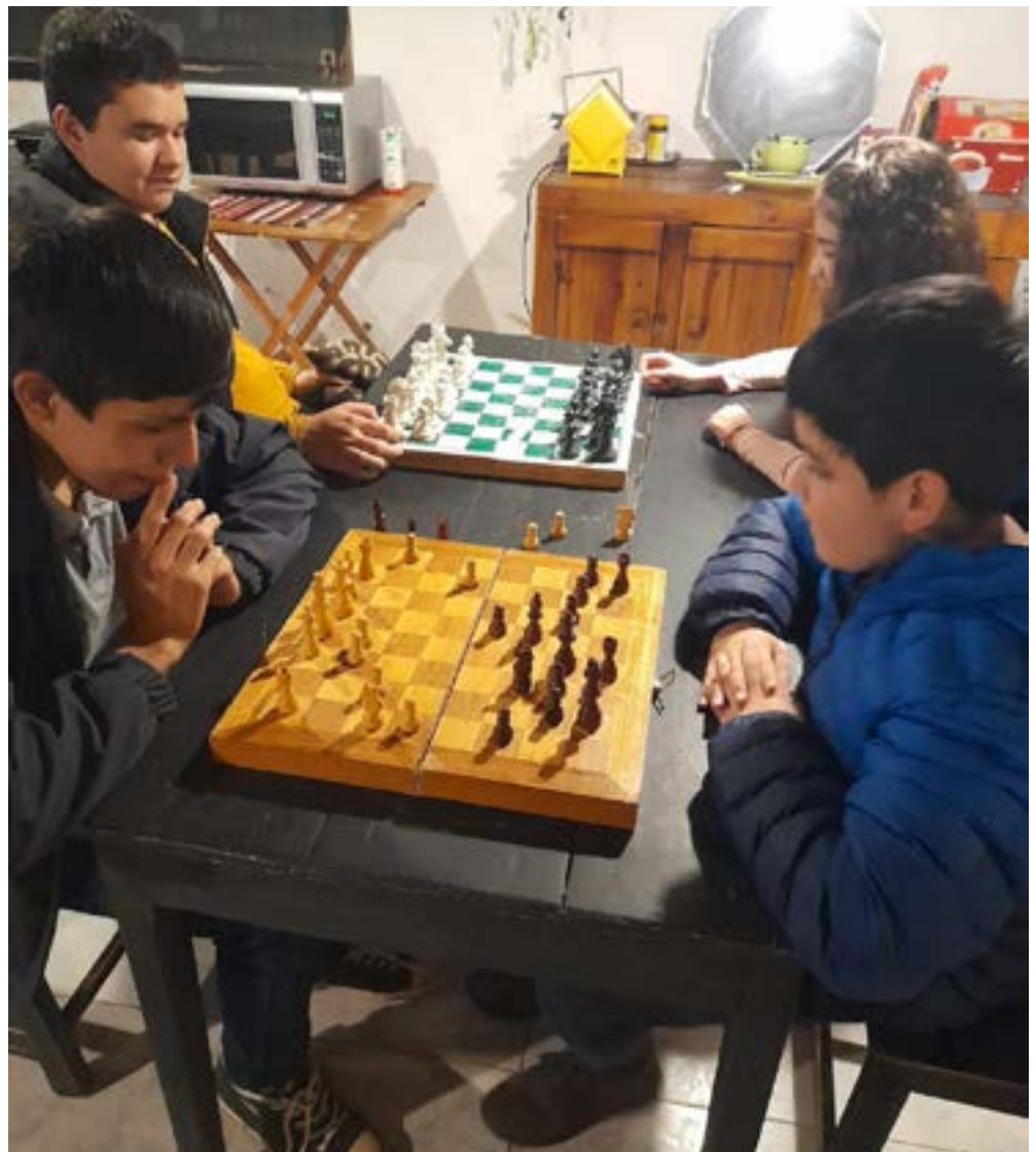
Luisana da clases presenciales todos los miércoles de 17:30h a 19:00h en el Hotel Acqua de San Bernardino.