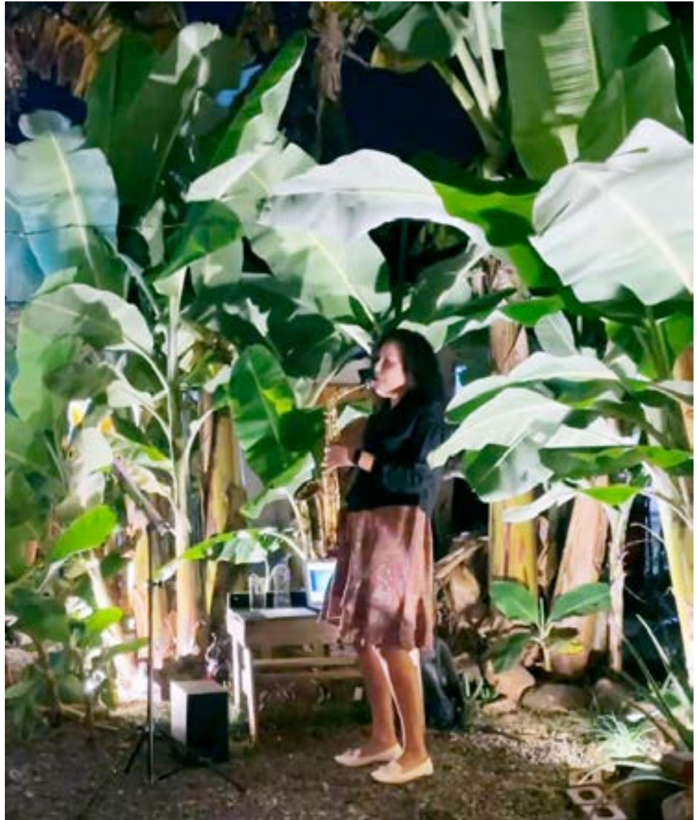
“Ahora ya estoy dando shows de jazz por San Bernardino y por Altos”.

No tengo fecha aún, pero debería... Entre las muchas cosas que me gustan, está mi carrera como investigadora en Ciencia Política, obtuve una Maestría en Metodología de la Investigación en la Universidad Complutense de Madrid allí me introduje