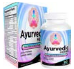
Suplemento de hierbas ayurvédicas (todo en 1) Suministro de 3 meses - Ayurveda Mind, Body & Spirit Herbal Blend Complejo con 17 ingredientes activos - Suplementos ayurvédicos naturales - 90 cápsulas