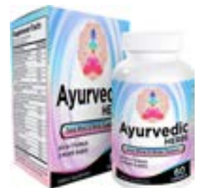
Hierbas ayurvédicas (All-in-1) Suplemento Suministro de 2 meses - Ayurveda Mind, Body & Spirit Herbal Blend Complejo con 17 Ingredientes Activo - Natural Ayurvedico.