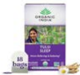
Organic India - Té orgánico de Tulsi , té de hierbas, 18 saquitos de infusión, 1 paquete