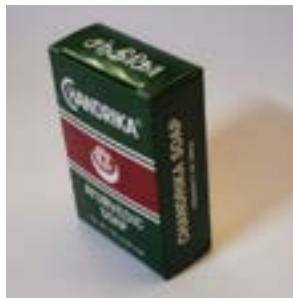
Chandrika Jabón ayurvédico para baño y cuerpo, paquete de 10 unidades, DIRECTO DE Chandrika - IMPORTADORES Y DISTRIBUIDORES AUTORIZADOS. DE ORIGINAL Chandrika LINE