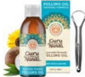
GuruNanda Oil Pulling - Aceite, aceite desintoxicante oral, mezcla ayurvédica refrescante de aceites de coco, sésamo, girasol y menta (8,45 onzas líquidas).