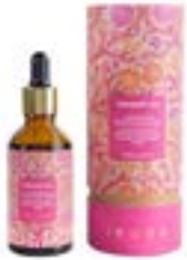
iYURA Aceite facial Kesaradi - Receta de 5000 años con azafrán exótico, cúrcuma y rosa, para una piel visiblemente más brillante, hidratante facial ayurvédico 100% natural para piel seca y sensible.

En resumen, los productos ayurvédicos ofrecen una amplia gama de beneficios para la salud, desde el fortalecimiento del sistema inmunológico y la desintoxicación del cuerpo hasta la gestión del estrés y la mejora de la digestión. Al integrar estos remedios naturales en la vida diaria, es posible alcanzar un equilibrio holístico que promueve el bienestar general y la longevidad.